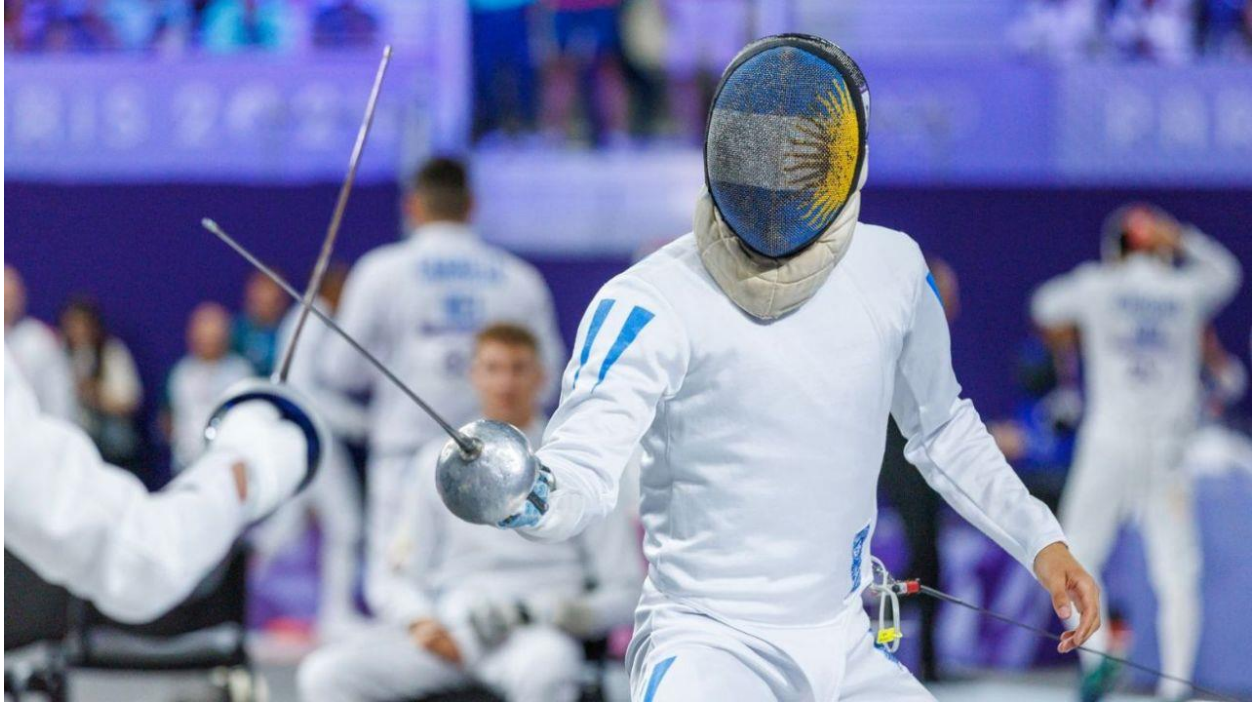
Franco compitiendo en esgrima por los Juegos Olímpicos 2024.