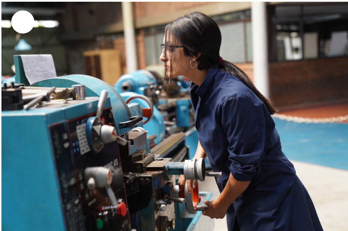
Una alumna de escuela técnica, el formato de secundaria argentina que forma en oficios y hace puentes con el mundo laboral.

Otro modelo exitoso -aquí mismo- es la escuela técnica argentina , especialmente diseñada para formar en oficios y que, desde hace años, tiene “prácticas profesionalizantes” en los últimos años de estudio.