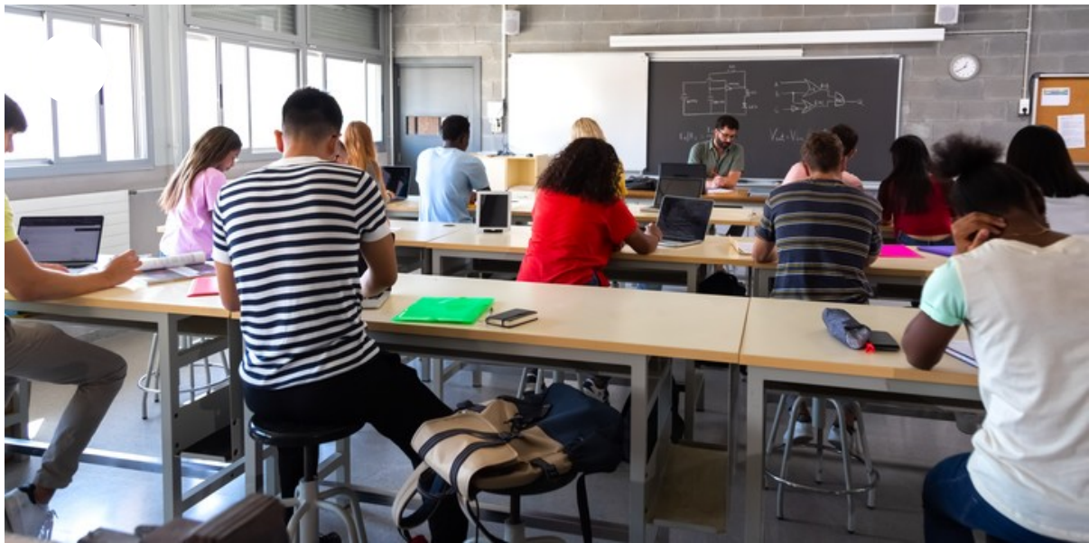
Escuela secundaria.

Para Guillermina Tiramonti, experta en educación e investigadora de FLACSO, “en el país hay ya propuestas de escuelas duales -el modelo alemán- en las que en los dos últimos años los chicos alternan el tiempo entre la escuela y una práctica laboral. También hay experiencias en las que la propia escuela combina formación para el trabajo con el estudio de disciplinas propia de los bachilleratos. El tema es que el desarrollo de las actuales tecnologías están transformando las formas de trabajo y con ello la división entre una formación técnica y una humanista”. puntualiza.