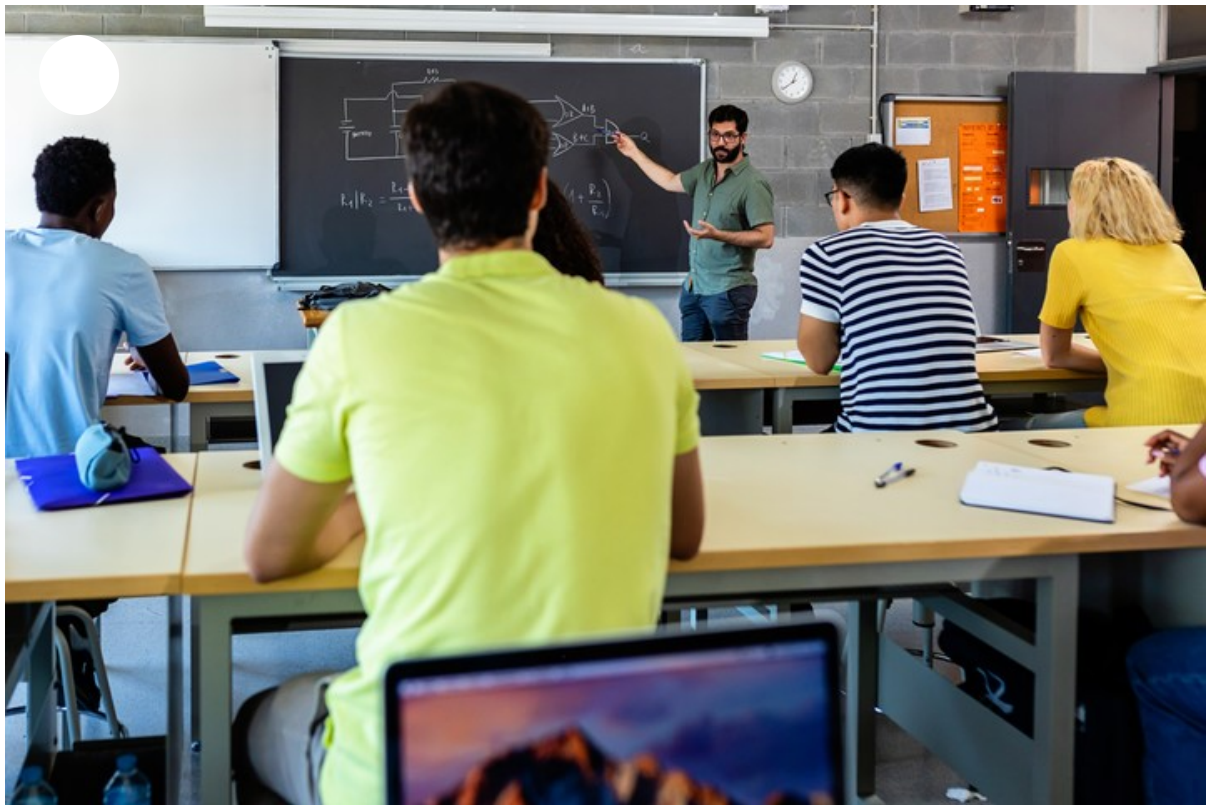
Escuela secundaria.

Paula Iglesias, responsable del área de Educación de UADE rescata que, si bien casi la mitad de los consultados opina que es más importante aprender oficios que terminar los estudios, “un número mayor de los encuestados (79%) está de acuerdo con que terminar el secundario garantiza mejores oportunidades de trabajo ”.