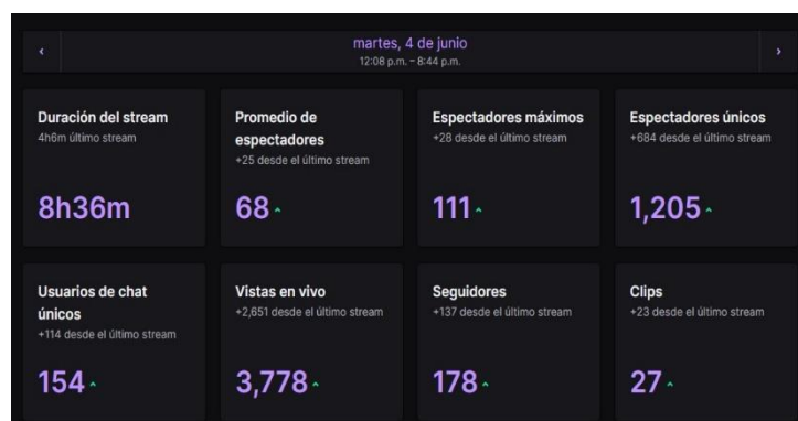
Las métricas del martes ya habían marcado una suba con respecto a la edición 2023.

Durante los Juegos UADE, no solo hubo un crecimiento exponencial en el lanzamiento del canal de streaming dedicado a Esports , sino que junto con el canal principal, JuegosUADE , la organización consiguió más de 15 mil vistas, con un pico de 550 viewers. En comparación al año pasado, que la media no superó los 30 espectadores, se registró un crecimiento marcado en la audiencia del evento.