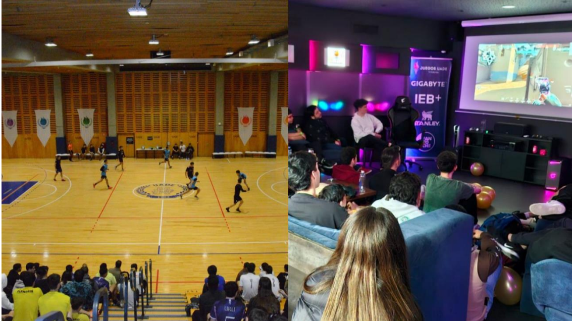
Juegos UADE tuvo dos canales de streaming por primera vez.

La sexta edición del torneo universitario de interfacultades rompió con las expectativas y superó en números a versiones anteriores.