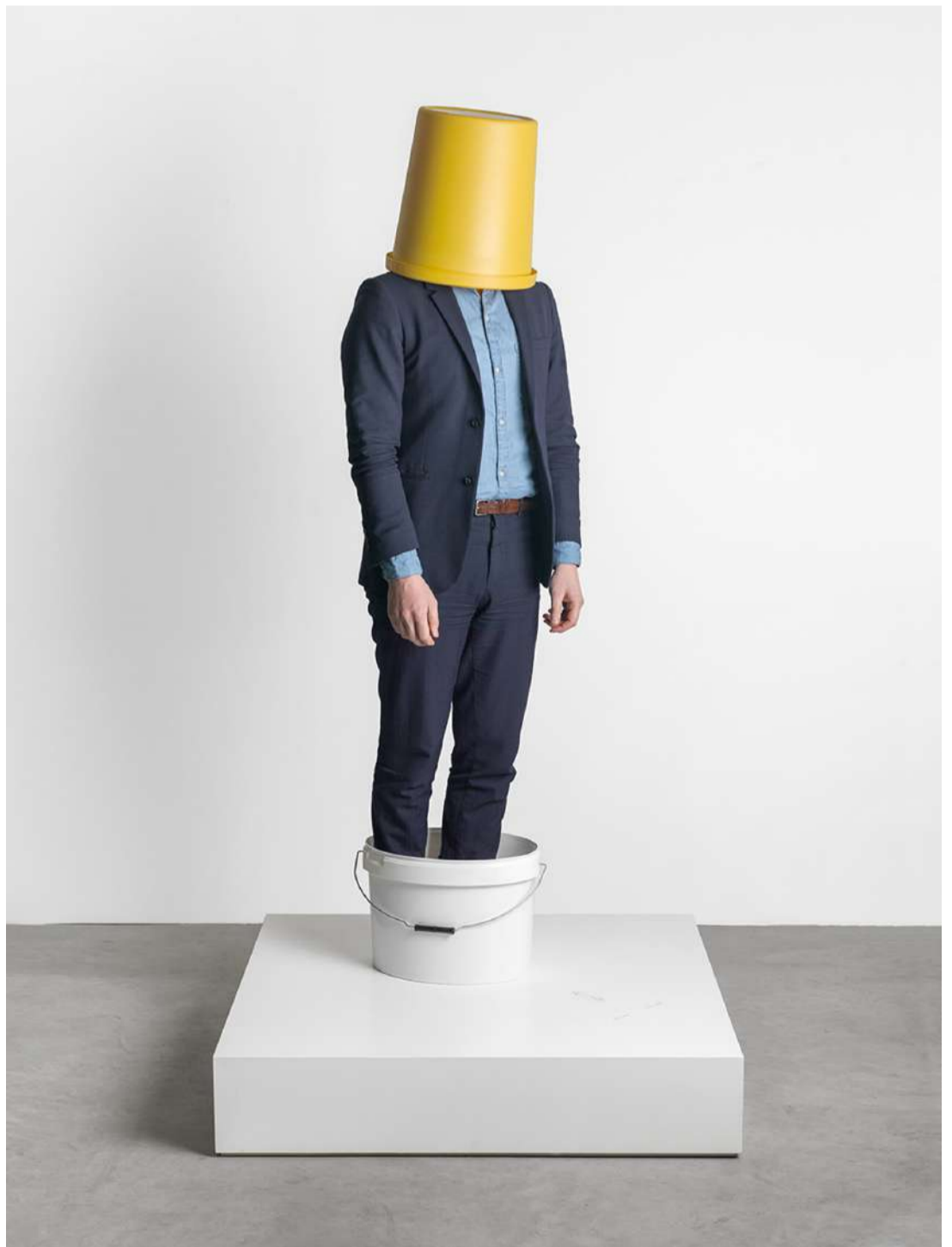
Erwin Wurm, One minute forever, 2018