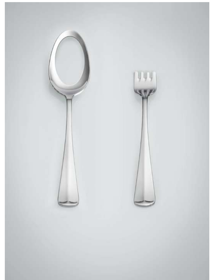
Frustrazioni, Silver spoon, silver fork, 2014