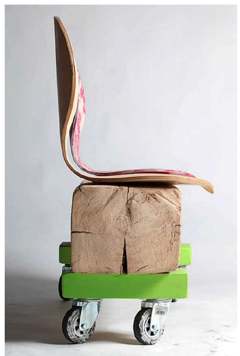
Salami Chai, Eco Design furniture by Luca Bornoffi 2022