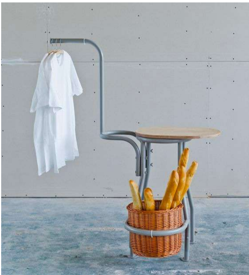
Studio rygalik: the kitchen at milan design week 2013