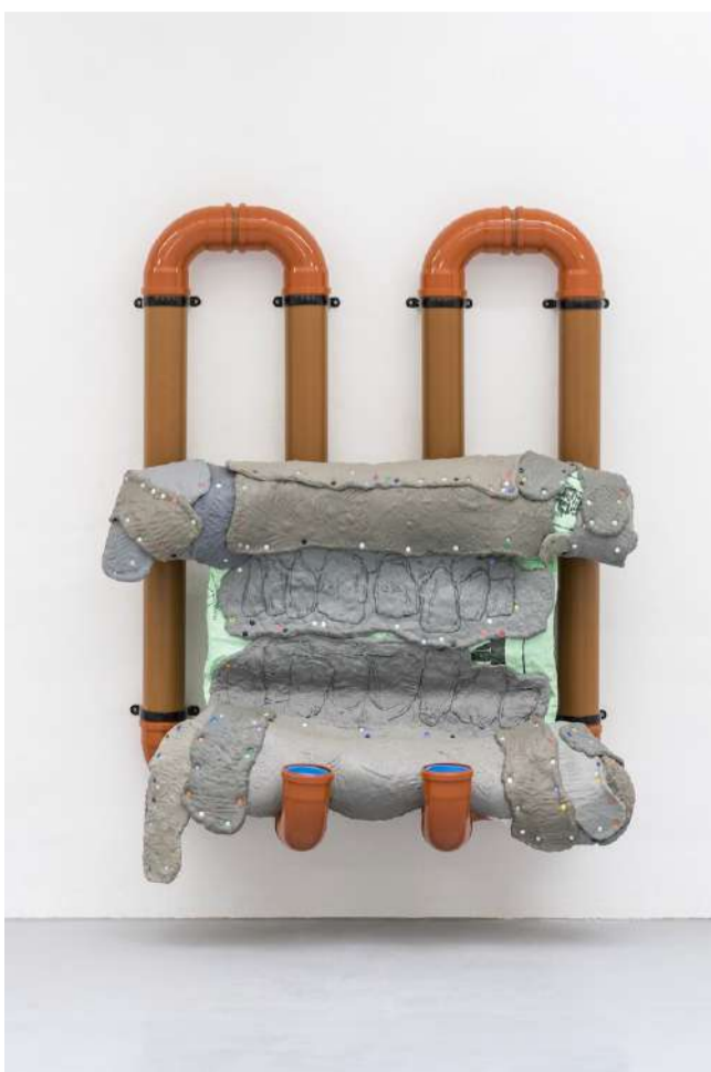
Sebastian Jefford's "Procrustean Flatulence", Vienna 2018